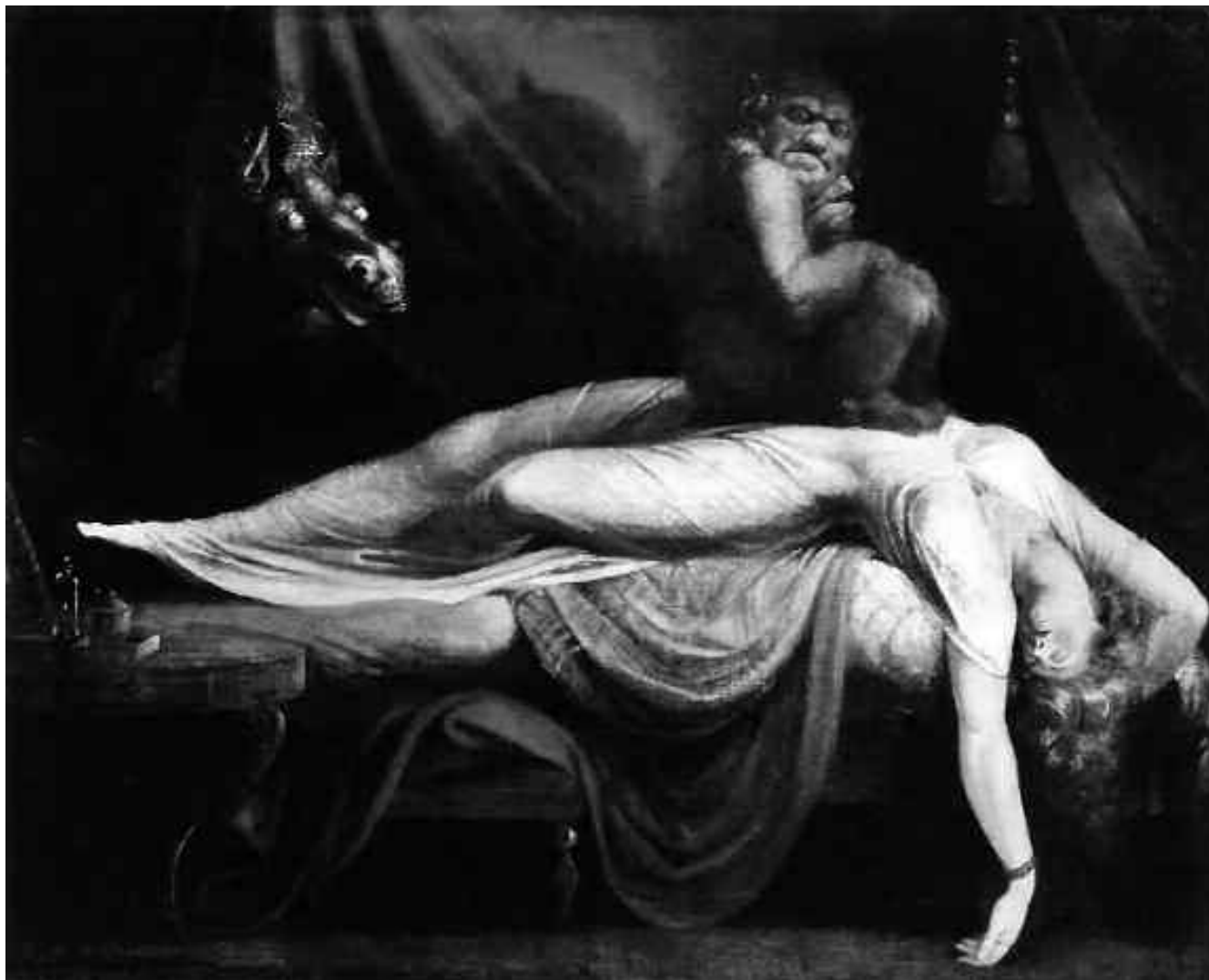
LE CAUCHEMAR d'Henry Fuseli (1741-1825), huile sur toile, Detroit, Institute of Art.

rationnel et au niveau émotionnel, on peut faire le parallèle avec ce qui s'est essayé chez nous, bien plus largement, dans les années 70 dont ils étaient en quelque sorte les précurseurs, quelques 200 ans plus tôt. Avec, cependant, une différence notable : il n'y avait à l'époque ni pilule, ni contraception et donc, en même temps qu'il fallait faire preuve de volontarisme pour user de sa raison, se combattre soi-même pour accorder sa vie et ses idées, Mary Shelley vivait ces contradictions dans sa chair même ; elle connut des grossesses difficiles, perdit des enfants en bas âge. Ses écrits oscillent entre cette recherche de rationalité et les difficultés, les tensions, les souffrances que ces idées induisaient au plus profond d'elle-même, dans sa vie émotionnelle, inconsciente.