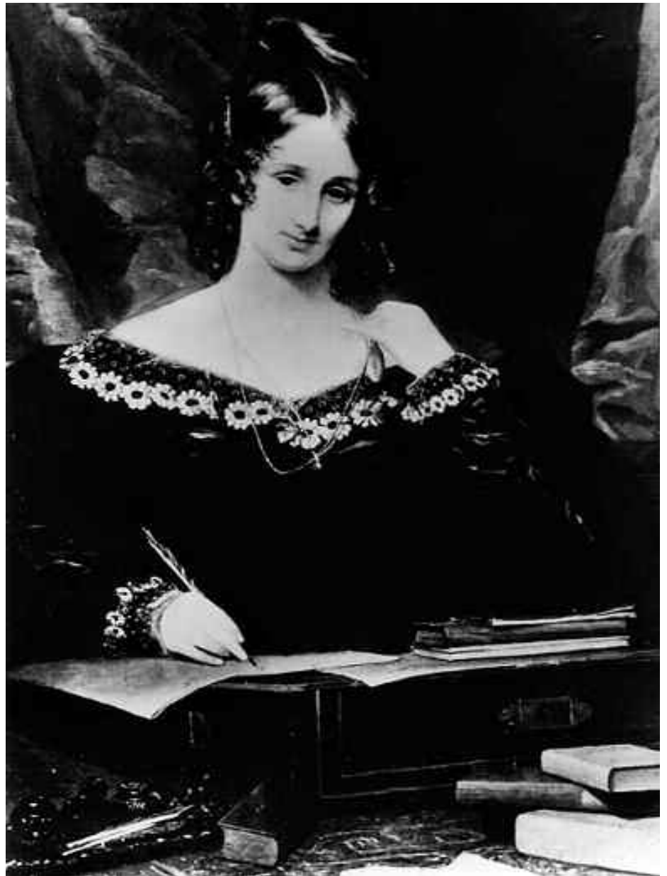
Gravure de Mary Shelley (début XIX e siècle).

Elle a grandi en Angleterre et en Écosse, et, à 17 ans, rencontre Percy Bysshe Shelley, un grand poète romantique anglais, à qui elle déclare sa passion sur la tombe de sa mère... Ils vivront à partir de ce moment une grande et forte histoire d'amour. Il était, lui aussi, engagé dans une recherche enthousiaste, réfléchissant aux moyens de créer une société nouvelle, d'autres rapports, d'installer